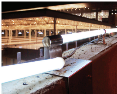
安装不合格的护栏灯