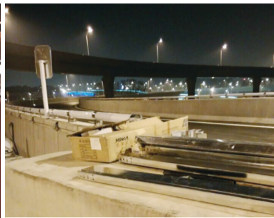
16日晚记者拍摄到部分灯具仍未装完