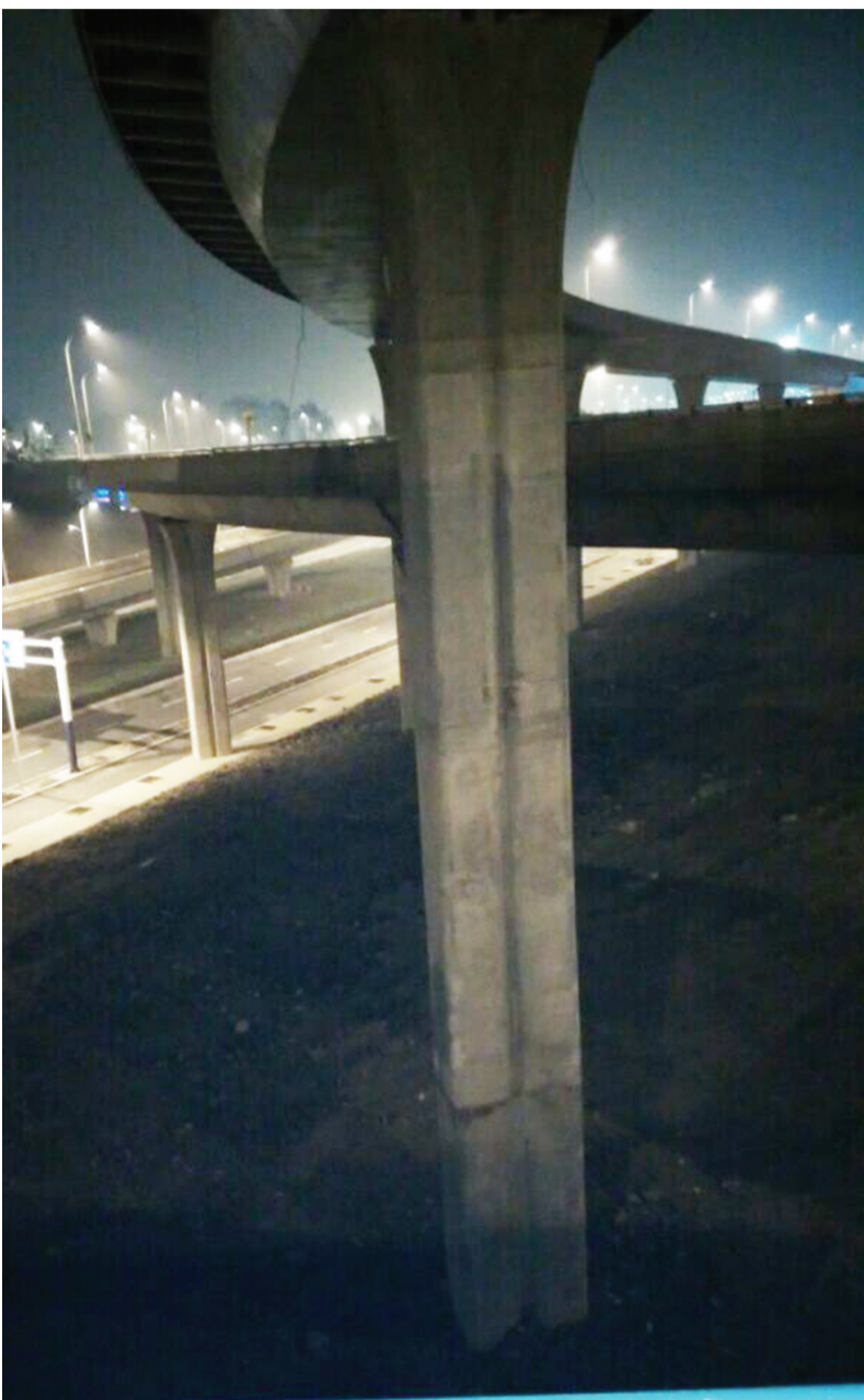
16日晚记者拍摄到高架桥下依旧漆黑一片