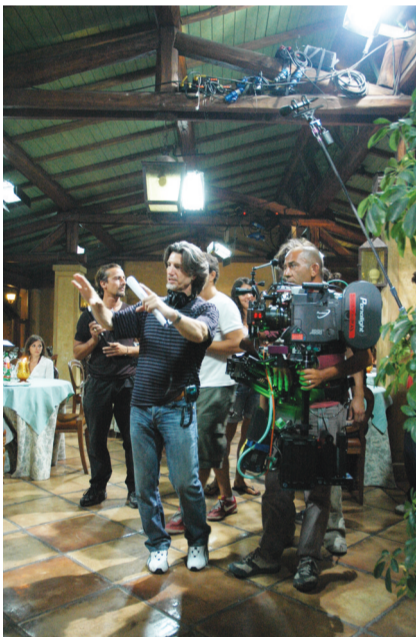
▲ 安东尼在工作中