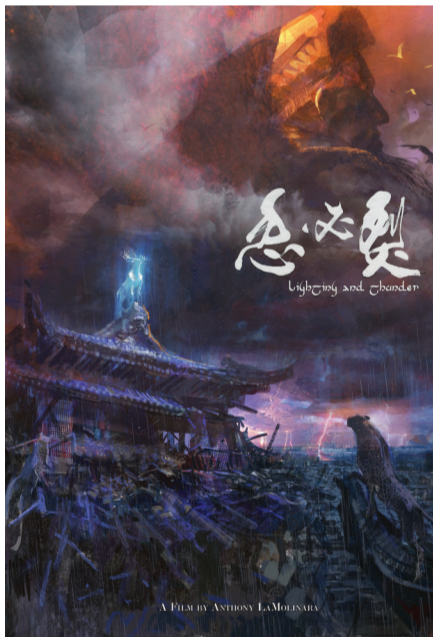
▲ 安东尼打算拍的电影《忽必烈》海报(安东尼提供)