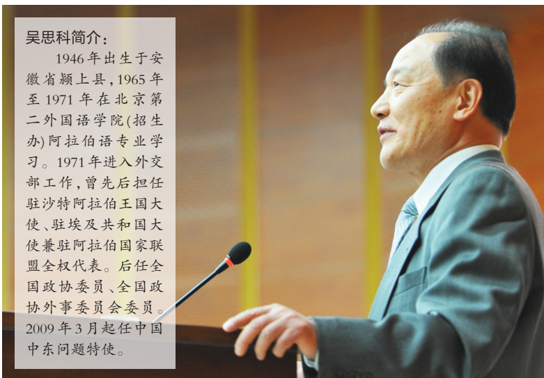
吴思科在安大做讲座

1946年出生于安徽省颍上县，1965年至1971年在北京第二外国语学院(招生办)阿拉伯语专业学习。1971年进入外交部工作，曾先后担任驻沙特阿拉伯王国大使、驻埃及共和国大使兼驻阿拉伯国家联盟全权代表。后任全国政协委员、全国政协外事委员会委员。2009年3月起任中国中东问题特使。