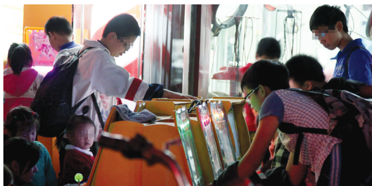
省城金盛小区对面是“弹子机”聚集地,很多孩子放学不回家沉迷在此