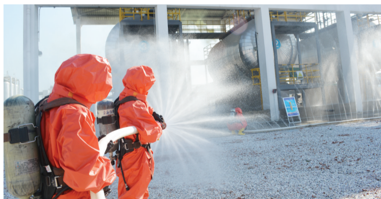
消防官兵用开花水枪对泄漏的氯气进行喷淋、稀释

合肥市政府接到报告后,分管副市长周善武决定立即启动《合肥市突发环境事件应急预案》,合肥市政府应急办通知安监、卫生、公安、消防支队等各成员单位及市环境应急管理中心、环境监察支队、环境监测中心站紧急出动,立即奔赴事故现场,并成立指挥部现场指挥。