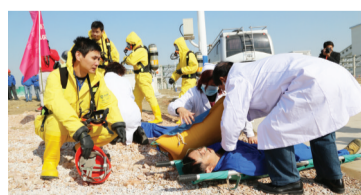
对“中毒”人员进行施救

上午9:53,在接到企业报告10分钟后,消防部门的5辆消防车已赶到事故现场。消防官兵用开花水枪对泄漏的氯气进行喷淋、稀释,同时对泄漏点进行封堵。另一组消防人员为进出事