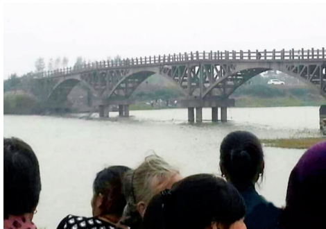
被害人尸体在凌家滩大桥下被发现