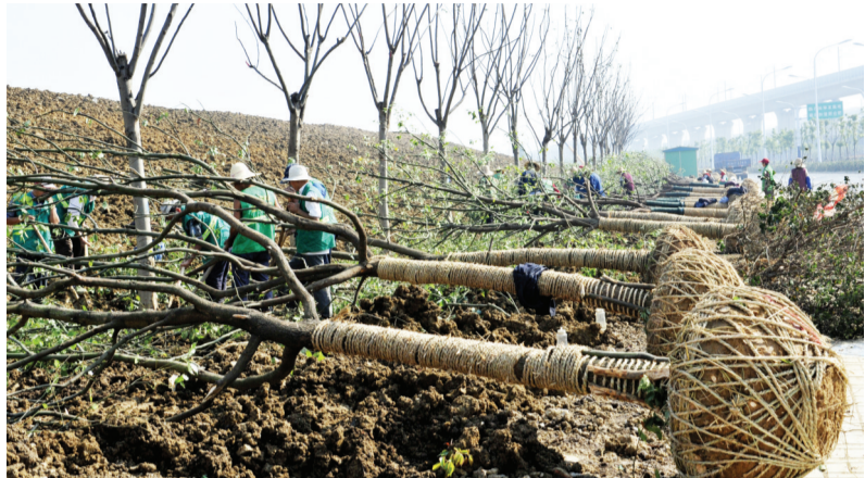
日前,合肥高铁沿线大规模的植树活动全面铺开,昔日的渣土堆即将变身森林长廊。红叶女贞、桂花、火棘等苗木,有层次有变化的道路绿化,不仅会改善中心城区的自然环境,还将给过往旅客带来一片如画风景。

昨日出让的最后一宗土地,是高新区KH3-1-1号地块,面积58.92亩,规划性质为教育科研,唯一一位竞买人合肥工业大学智能制造技术研究院有限责任公司,以底价58万元/亩的单价取得了该宗地的使用权。