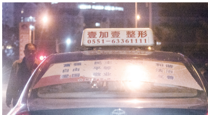
出租车的后玻璃被遮得严严实实