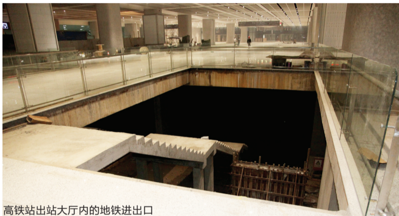
高铁站出站大厅内的地铁进出口

由于高铁南站开放在即,用不了几日,合肥南站地铁换乘站的入口就将暂时封闭,市民通过南站乘坐高铁出行的同时,暂时“隐藏”的合肥南站地铁换乘站将“悄无声息”地在乘客脚下继续“蜕变”,静待地铁1号线整体试运行后的“重现天日”之时。