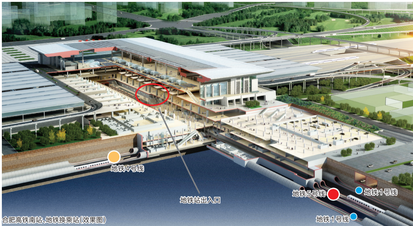
合肥高铁南站、地铁换乘站(效果图)