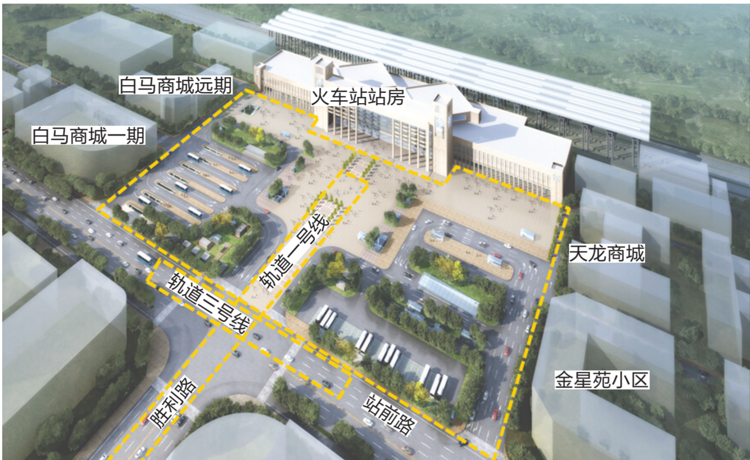
改造后的火车站广场

站前路(全椒路—站西路)中心隔离护栏继续保留,用以控制行人穿行,沿线适当位置保留过街通道;东发路交口处隔离护栏为活动样式,用作应急保障。