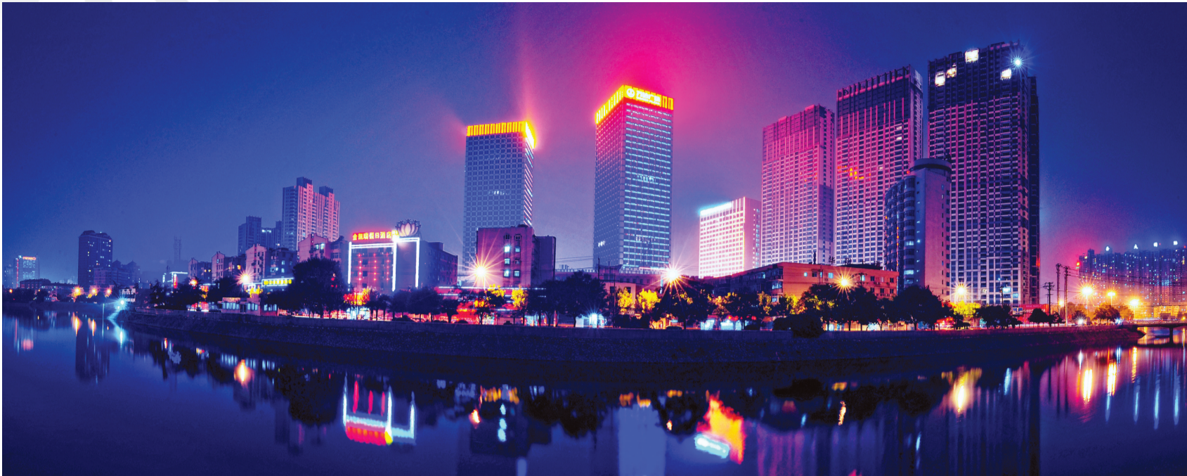
包河万达广场商业圈夜景