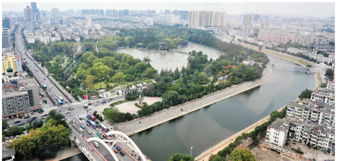
大东门逍遥津公园绿树成荫