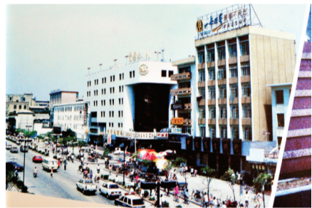
上世纪90年代长江路