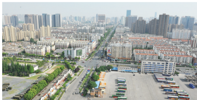
合肥北城区高楼林立