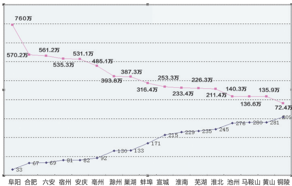
安徽城市人口排名(截至2010年11月1日零时)

根据2013年合肥、阜阳市统计公告来看，阜阳市户籍人口已经达到1053.2万人，常住人口771.6万人；合肥市常住人口761.1万人，户籍人口711.5万人。据有关专家分析，虽然目前合肥人口数少于阜阳，但在未来几年，随着经济建设的飞速发展，合肥人口还将快速增长，可能用不了几年就将成为全省人口最多的城市。