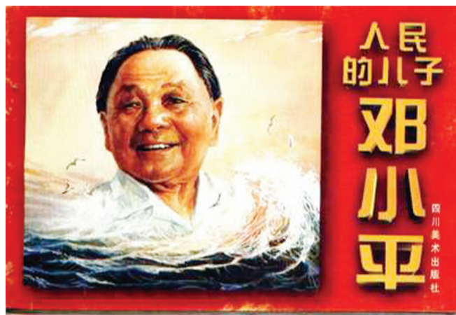
人民的儿子 邓小平

今年是邓小平同志诞辰110周年,各种缅怀活动都在开展。与此同时,邓小平题材的小人书也火热起来。这里特介绍一些邓小平题材连环画,以飨读者。