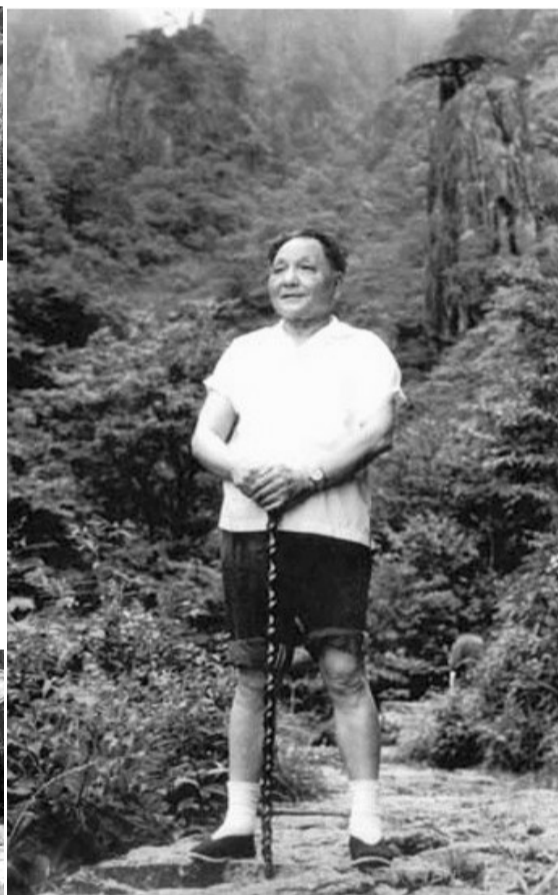
1979年，邓小平徒步登黄山。(资料图片)