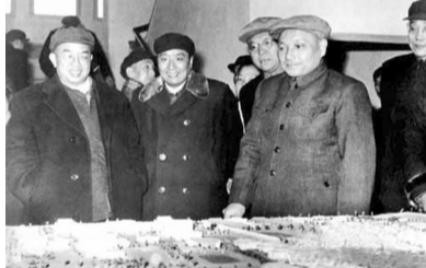
1960年2月邓小平在安徽大学视察。左一为时任省委第一书记曾希圣。(资料图片)