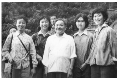
邓小平1979年在黄山与大学生合影。(资料图片)

“可以说，中国科技大学在前四十年办学过程中，每一步前进历程，每一个重大成就，都与‘邓小平’这个光辉的名字紧紧联系在一起。”郭传杰表示，邓小平同志给中科大留下了宝贵的理论和精神财富，也鼓舞中科大继续前进。