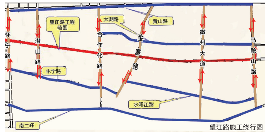
望江路施工绕行图