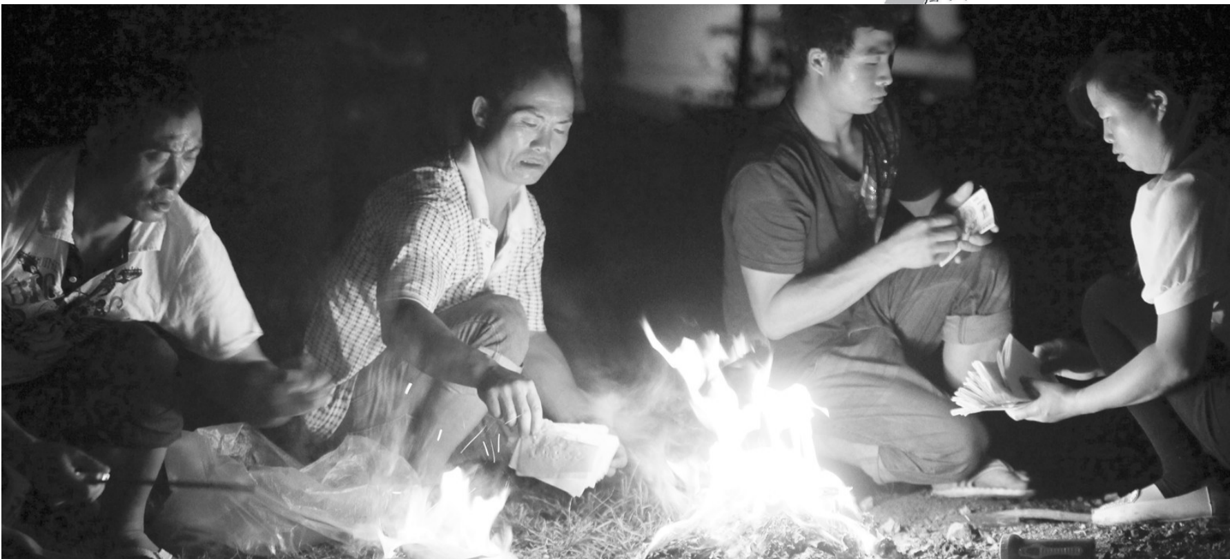
8月9日晚,几名受灾群众在野外祭奠在地震中遇难的亲人