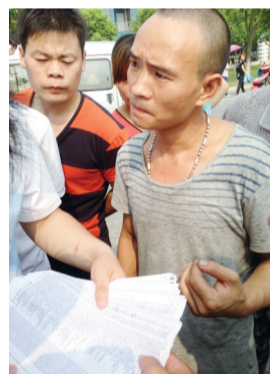
家属焦急地寻找亲人的信息