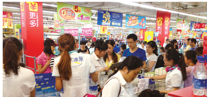
市民抢购恒大冰泉

此外,恒大冰泉生产线的主要设备均从德国进口,各环节均采用世界上最先进的生产工艺,并直接在长白山水源处引流取水灌装,全程避免二次污染,严格保证了水温水质不受外界因素影响,有力地保