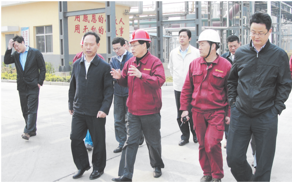
省人大常委会委员、农业和农村工委主任吴金山，省环保厅副厅长殷福才检查濉溪大气污染防治情况。

近年来，在县委县政府的正确领导下，在省、市环保局的关心支持下，濉溪县环保局强力推进生态环境保护与监管力度，围绕《环境保护法》的贯彻落实，推动濉溪县环境保护工作再上新台阶，为建设“实力濉溪、活力濉溪、魅力濉溪、美好濉溪、生态濉溪”打下坚实基础。