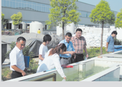
县环境监测人员对化工企业开展环境监测