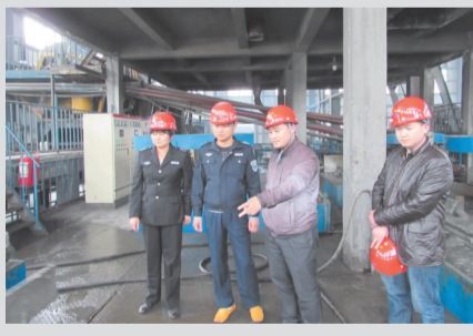
县环境监察人员开展环境执法检查