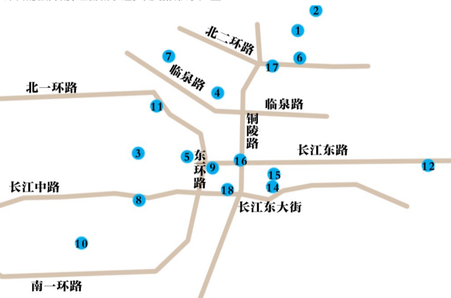
合肥昨日18处内涝区域: