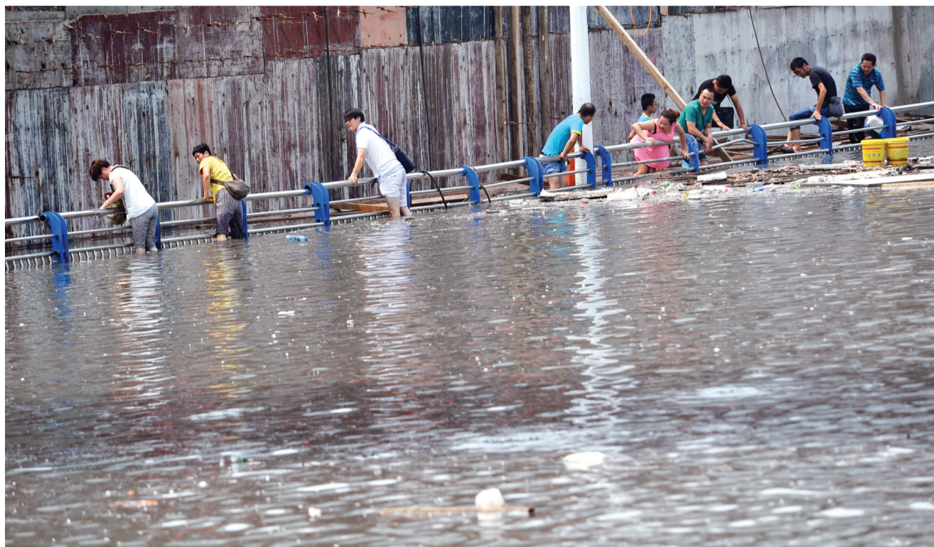
昨日的强降雨,让省城东边多处路段积水严重