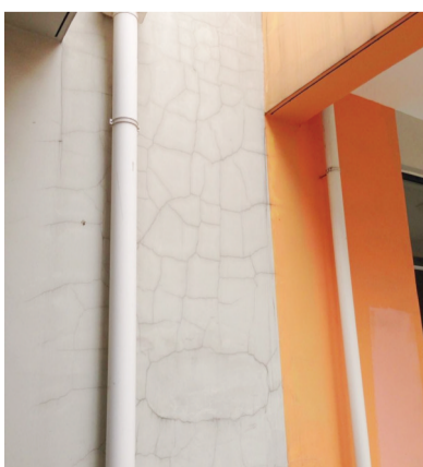
小区幼儿园的外墙出现龟裂