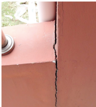
19栋一楼站柱与底层粘合处断裂