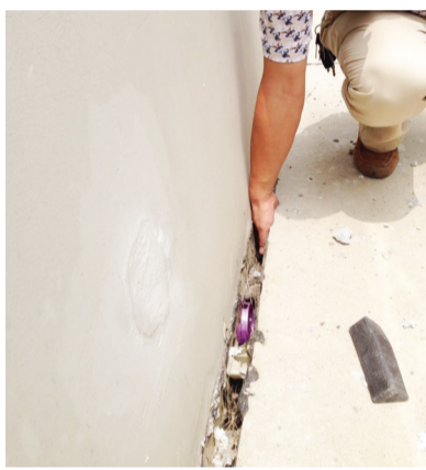
17栋一楼外墙出现裂缝 可塞进手掌