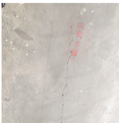
17栋2401室地面出现裂缝