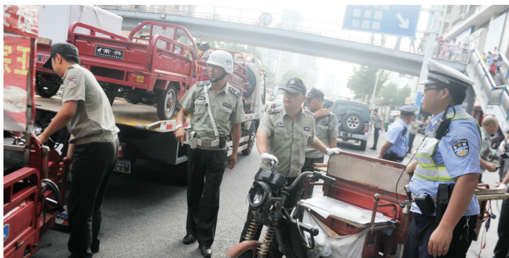
城管协同民警对街面违法占道经营现象进行整治