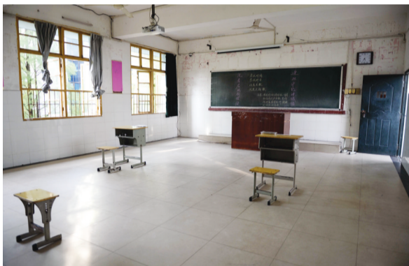
单独考场已布置完毕