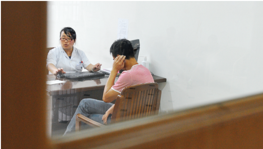
抑郁症门诊, 医生和患者在交流