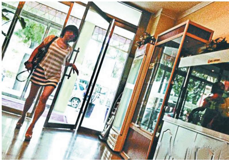
奶妈“小雨”(化名)现身约定的一家宾馆

这些人会费只是门槛费，每次约见奶妈，客户都需要支付600~2000元不等的费用给奶妈，并支付给“奶妈论坛”一定的担保费。客户可以选择按次或者包月等方式结账，随着奶妈质量和付费方式的不同，交给“奶妈论坛”的中介担保费用从500~10000元不等。此外，在喂奶活动中，一般开房、吃饭以及奶妈的交通费用也是客户支付。