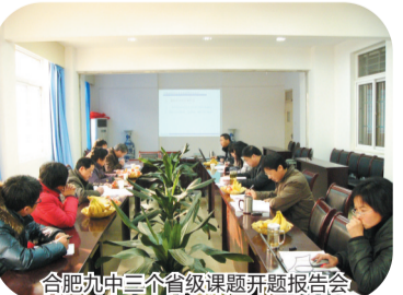
合肥九中三个省级课题开题报告会

合肥九中精就精在教师队伍,他们师德高尚、素质精良、战斗力强,树立起能师形象、学者形象和绅士形象。