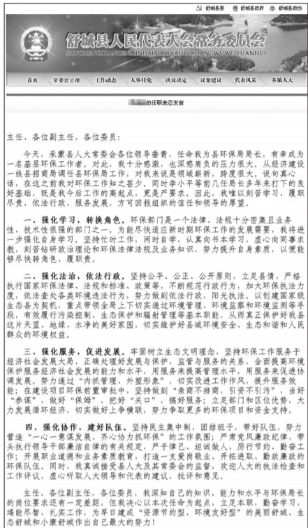
被指雷同的两份供职报告

任职报告是机关负责人就任职一定时期内所做工作向任命机关或机关群众进行汇报并接受审查和监督的陈述性文案,是考察干部履行职责情况以及是否称职的一种手段。可是,本报近日接到舒城县读者反映称,该县环保局的最近两任局长,在就职时向该县人大常委会提交的供职报告“基本雷同”。记者采访当事新任局长时,他称该份供职报告系自己所写。