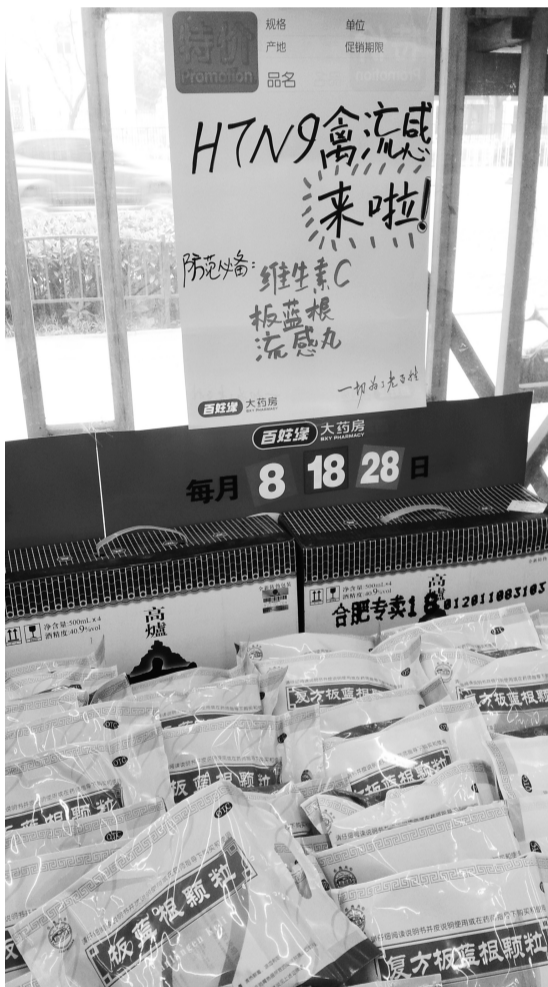
4月5日,省城一家药店打出板蓝根促销店招

合肥市疾控中心相关负责人表示,市民不应过度恐慌,鸡鸭等禽类也并非完全不能吃,但一定要吃煮熟煮透的,不要吃半生不熟的,比如溏心鸡蛋、带血丝的鸡肉等,