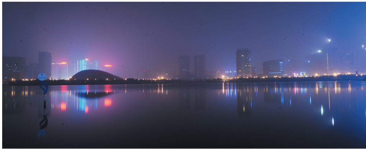
昨晚天鹅湖畔熄灯前后