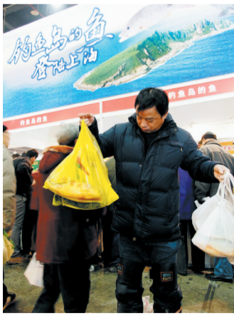
顾客在购买钓鱼岛鲜鱼

综合新华社报道 1月26日,来自我国钓鱼岛附近海域的鲜鱼运抵上海光大会展中心,8000斤新鲜马面鱼、马鲛鱼、青鲛鱼、红鲳鱼被众多顾客抢购一空。