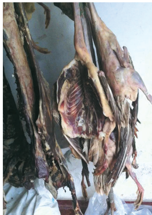
故意在花鹅翅膀上留着羽毛,以此骗人