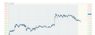
现货黄金 11月19日-11月28日走势图