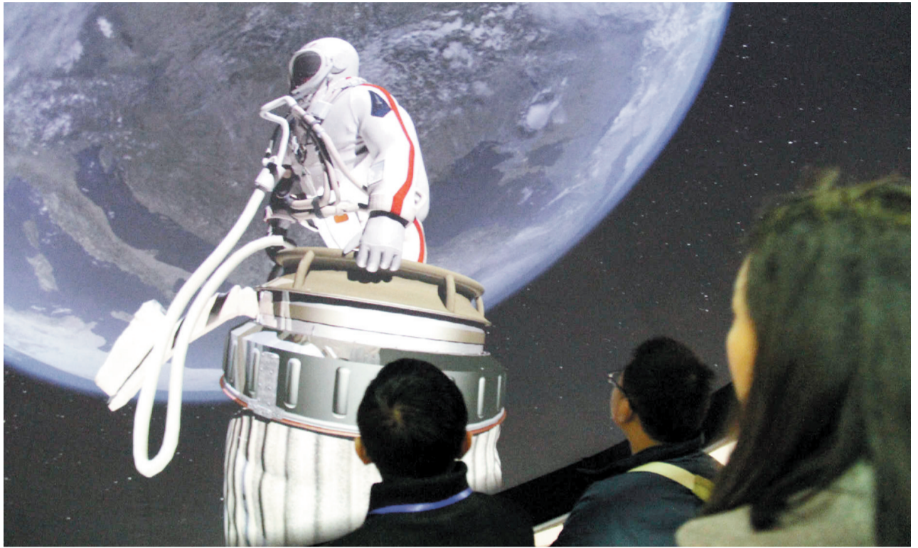
参观者体验观看球幕影片

11月23日，第五届中国(芜湖)科普产品博览交易会在芜湖盛大开幕，在科博会现场，“神九”返回舱实物、降落伞实物、天宫一号1:1交会对接模型、“蛟龙号”模型等亮点纷呈。