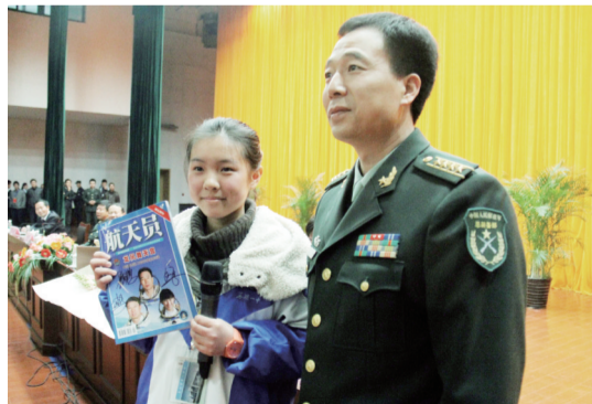
获赠签名杂志的学生代表与景海鹏合影