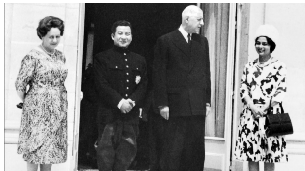
1964年，西哈努克会见法国总统戴高乐。