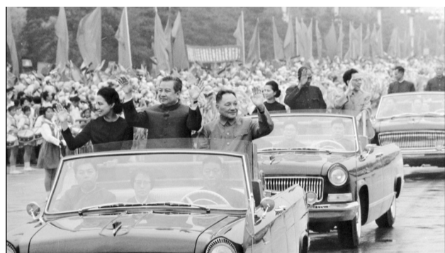
1975年9月9日，北京，邓小平、西哈努克与妻子向民众挥手致意。