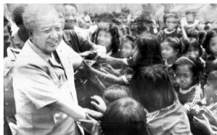
1990年，西哈努克访问一小村庄。