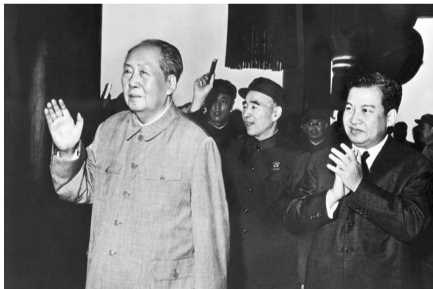
1970年5月22日，毛泽东会见来访的西哈努克。