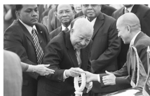
2012年，西哈努克前往中国进行健康检查。