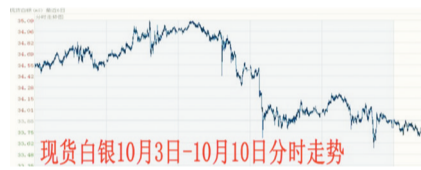
现货白银10月3日-10月10日分时走势