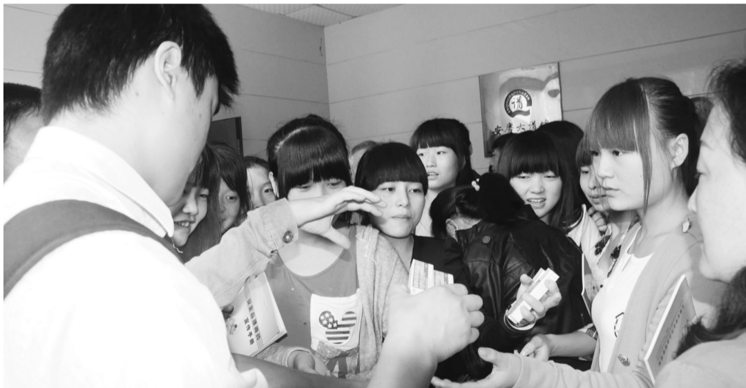
现场赠送《安全饮食用药知识科普读本》和日常药品

星报讯(王汝华 记者 何曙光文/图) 昨日上午,由省食品药品监督管理局、市场星报社、安庆市食品药品监督管理局、省药学会、省执业药师协会联合主办,省医药(集团)股份有限公司、盈天医药集团公司、安庆市图书馆、三九医药贸易有限公司协办的大型公益活动——“安全用药大讲堂”第三季第一场活动,在安庆市成功开讲。