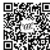
扫码阅读 更多资讯

选择手术经验丰富的医生非常重要，因为在眼睛上往往是“失之毫厘，差之千里”。国内权威整形美容机构解放军105医院借助于部队三甲综合医院的优势进行专家资源优势整合、共享，技术与艺术完美结合的专家团队为“韩式美神双眼皮微雕术”提供值得信赖的技术保障，实现了让安徽爱美人士在家门口也能享受到国际级的美眼服务。