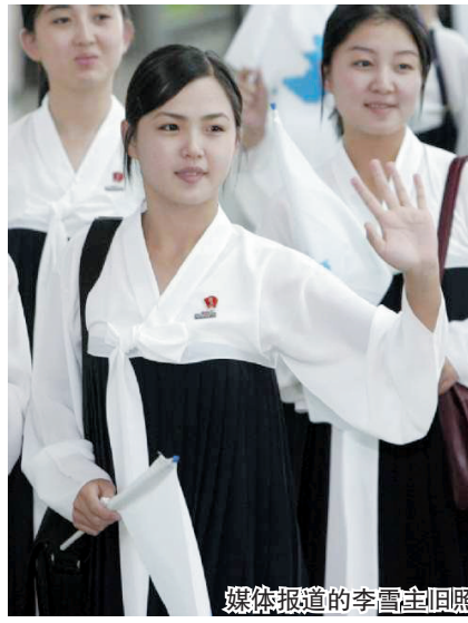
媒体报道的李雪主旧照

星报综合报道 朝鲜官方传媒证实最高领导人金正恩结婚后,韩国传媒周四争相报道朝鲜“第一夫人”李雪主(前译李雪珠)的背景资料,指她以前是歌手,曾为金正日和金正恩表演,被两父子看中。据报她曾接受六个月特训,学习做“第一夫人”。 韩国传媒报道,李雪主为银河管弦乐团成员,在一次大除夕表演时,受观众席欣赏表演的金正恩及金正日注意。 据报,她与金正恩结婚之前,在朝鲜最高学府金日成大学特训6个月,学习作为第一夫人。韩国《朝鲜日报》则指,在去年底前,她在朝鲜银河管弦乐团内十分活跃。2011年1月,朝鲜中央电视台播出银河管弦乐