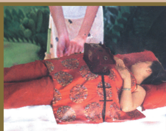
悬灸祛寒养生 单次200元 体验价150元

一店地址: 合肥大通路大通小区3幢101室 二店地址: 合肥大通路海汇大厦东100米 三店地址: 合肥长丰路翡翠园大门南边150米