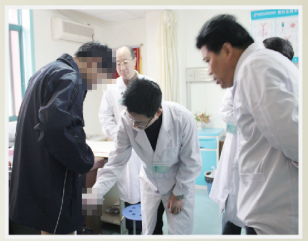
专家会诊疑难病例