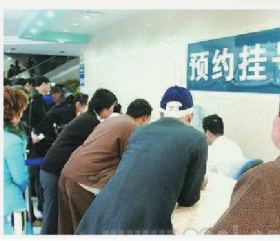
家长陪同 预约挂号