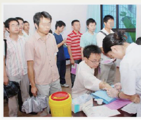
预约青年 术前体检