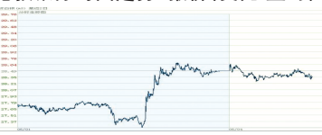
6月4日6:00—6月5日15:00 伦敦银分时图走势图 报价(美元/盎司)

6月4日-5日,现货白银走势维持震荡,至5日下午3点,高点28.66,低点27.99。