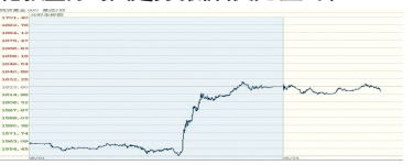
6月4日6:00—6月5日15:00 伦敦金分时图走势图 报价(美元/盎司)

6月4日,美国量化宽松(QE3)的可能性再次上升,昨日金价在1600上方宽幅震荡,最高1627,最低1608。