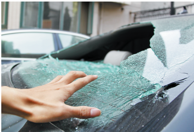
奥迪车的后挡风玻璃被砸破裂