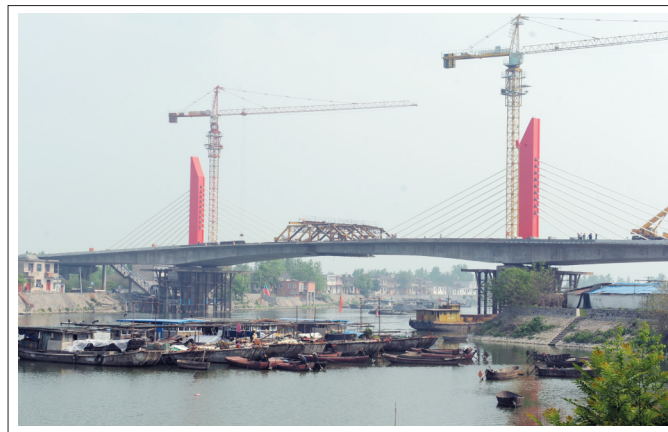
作为环巢湖公路一个重要组成部分,南淝河大桥的工程进度备受市民关注。记者昨日从现场获悉,目前施工已进入收尾阶段,最快将于五一具备通车条件。 施亚磊 记者 黄洋洋 文/图

而对于大企业来说,日前合肥刚刚搭建银企对接平台,提供金融服务,因此资金对它们问题不大,但拿地还需精准。