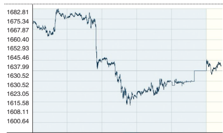
伦敦金4.2—4.9日，总体走势先升后降，最高点1683，最低点1611。