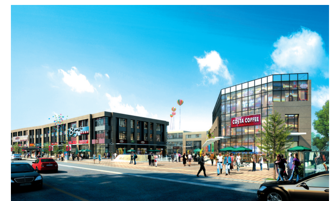
意外的惊喜与心动……花上半晌时间来追梦淘宝,人流不歇却也惬意、洒脱;那怀旧的、新潮的、古朴的、前卫的对立与融合,一一在小巷中沉淀。