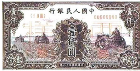
千元版第一套人民币

千元版第一套人民币种类比较多,有“三台拖拉机”图、“钱塘江大桥”图、“牧马”图等多种,这些种类中尤以“牧马”图版最为有价值,其收藏价值现在高不可攀。此外,“伍佰元”的“瞻德城”和“壹万元”的“骆驼队”收藏价值也较大。