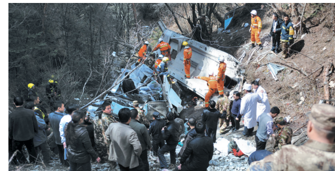
这是山沟下的事故现场