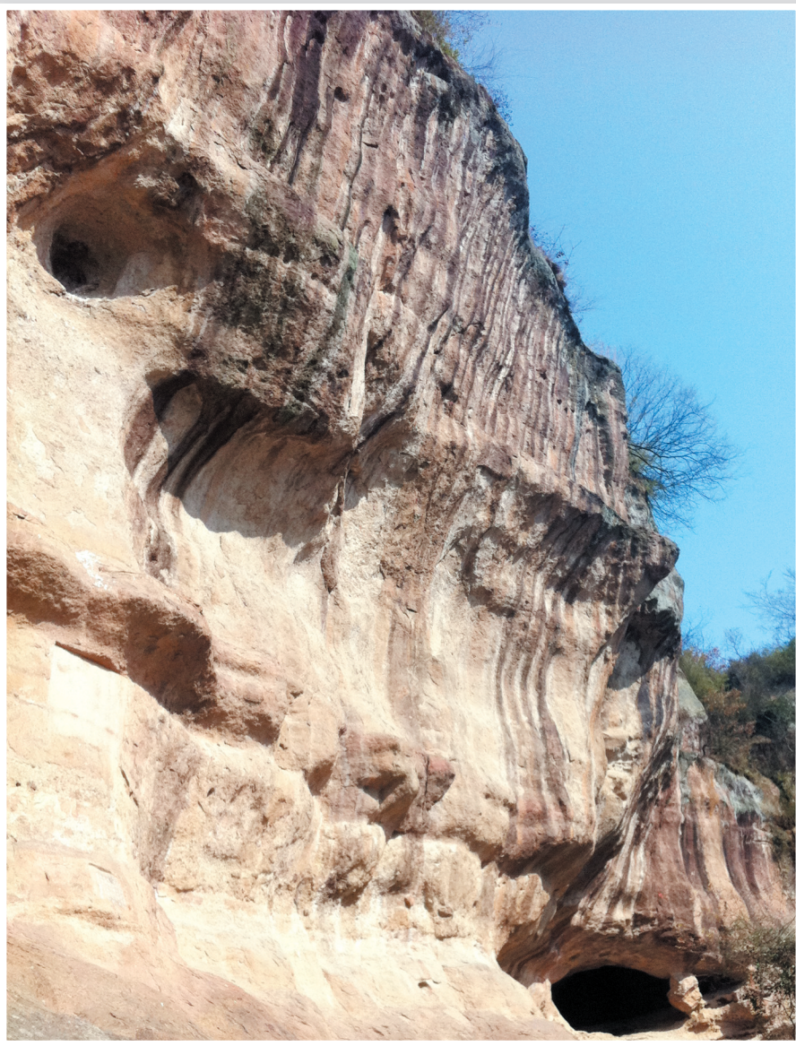
抬头仰望，那顺岩壁而下的黑色印迹就是当时火山喷发时的岩浆流过。