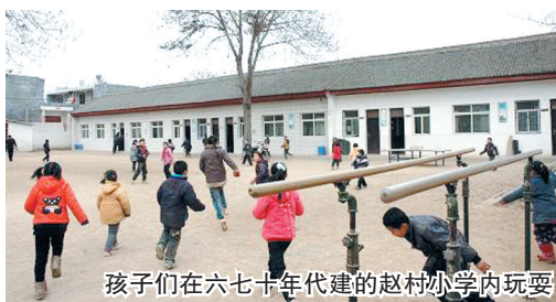
孩子们在六七十年代建的赵村小学内玩耍

位于陕西省渭南市高新技术产业开发区白杨街道办事处赵村逸夫小学,2010年5月投入使用。然而,学生们在进入逸夫小学学习仅两个星期以后,就被告知需要返回原来的校舍学习。如今,学生们依旧在原来老旧校园内上课,赵村逸夫小学的校址已是当地一家为两个品牌的汽车提供4S服务的营业机构。