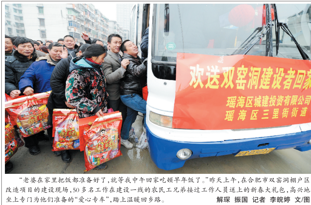
“老婆在家里把饭都准备好了,就等我中午回家吃顿早午饭了。”昨天上午,在合肥市双密洞棚户区改造项目的建设现场,50多名工作在建设一线的农民工兄弟接过工作人员送上的新春大礼包,高兴地上车为他们准备的“爱心专车”,踏上温暖回乡路。 解琛 振国 记者 李皖婷 文/图

据悉,项目投资达2.5亿,共有约1000门程控电话,一期大约能解决2500-3000人就业。