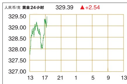
黄金24小时纽约现货价格走势

专家指出,如果要让全体国民享受石油产业链的暴利,可以通过降低原油和石油产品零售价格的方式让民众得到实惠。